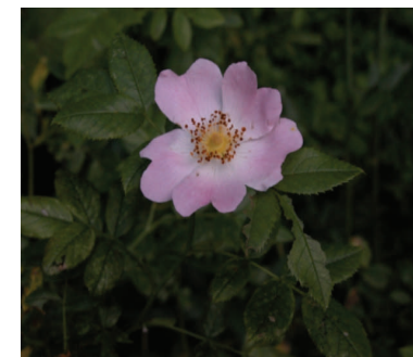
"Birgittarosen" - Rosa Rubiginosa på Mariager Kirkegård