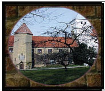
Mariager Kloster og Kirke

Det første Birgittinerkloster blev indviet i Vadstena ca. 1374, og i årene 1390 - 1420 blev flere kløstre grundlagt i Italien, Tyskland, Estland, England, Nederlandene, Finland og Danmark.