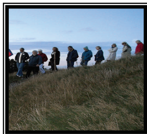
Pilgrimsvandring ved Hohøj

Foreningen tilbyder foredrag med tilknytning til Den Hellige Birgitta og bestræber sig på at finde de mest velbevandrede indenfor emnet.