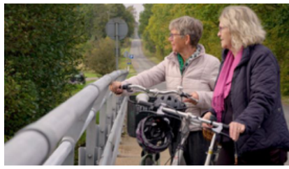
På cykeltur i Søhøjlandet