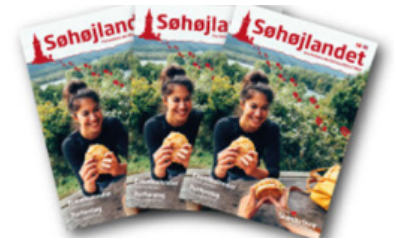
Se det flotte magasin