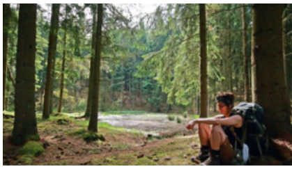
På vandretur i Søhøjlandet